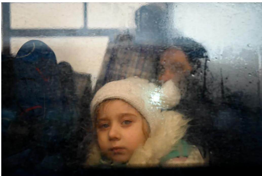
FIGURE 15 – Une fillette dans un bus évacuant des réfugiés ukrainiens vers la Moldavie une semaine après le début du conflit.

le présent. Chaque époque a ses propres stéréotypes, et Dostoïevski parle de la guerre en étant presque émerveillé de celle-ci, vue comme une fête pour un peuple qui a la possibilité de montrer son accomplissement ». La vérité viendra des exilés, leurs émotions sont plus proches du drame.