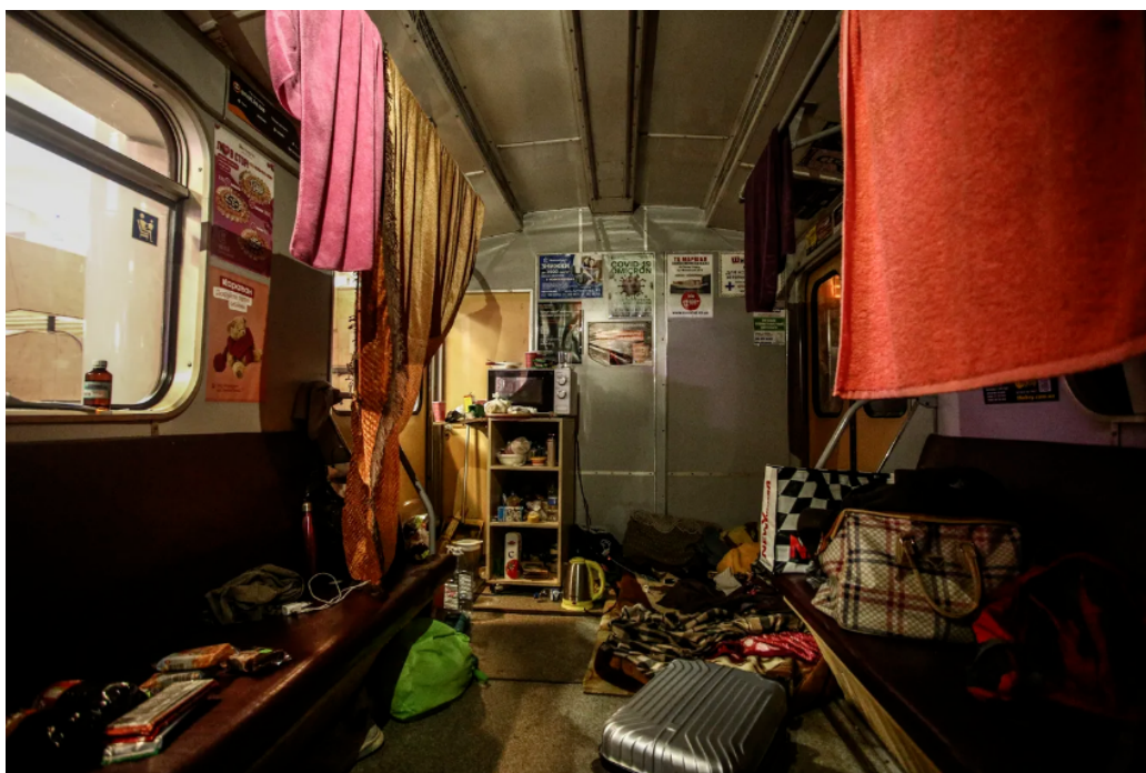
FIGURE 10

Plus affectée encore par cette attaque injustifiable, la mouvance idéologique de la gauche anti-impérialiste ne s'en relèvera pas. Si certains crurent qu'elle survivrait à la guerre froide, elle perd tout espoir de voir un gouvernement légitime s'opposer à l'ordre libéral : Noam Chomsky donne par avance un quitus à Biden et Zelensky.