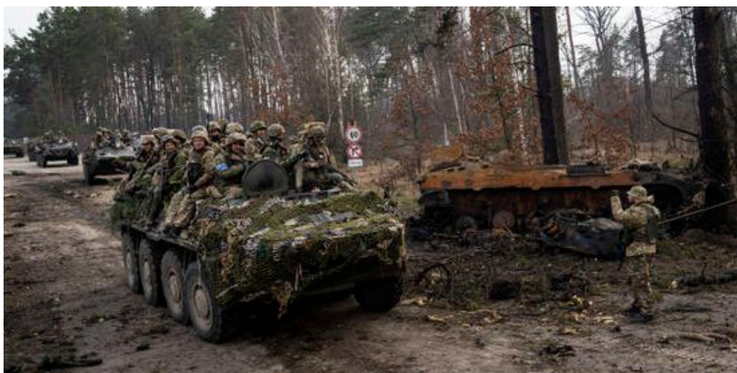
FIGURE 2 – Dans les environs de Kiev, fin mars, soldats ukrainiens et chars russes détruits.