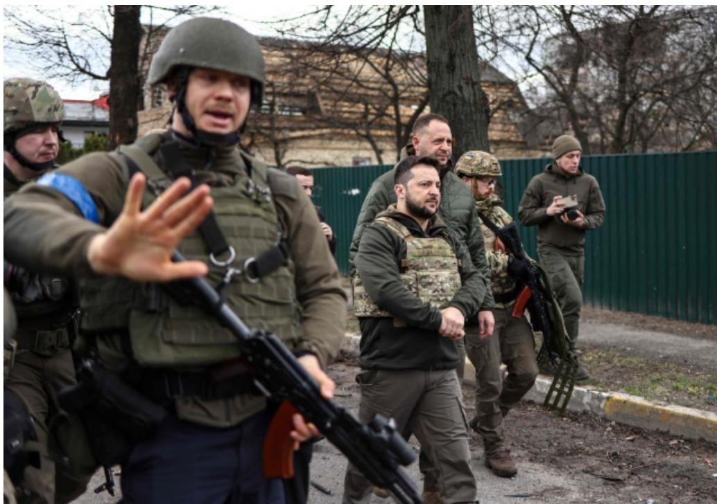
FIGURE 1 – Volodymyr Zelensky visite Boutcha dévastée, à la veille de son intervention aux Nations-Unies. Le président ukrainien est sur tous les fronts depuis le 24 février 2022, son énergie a transcendé une situation impossible pour résister à l'invasion russe, renforcer l'appui militaire américain et européen, et galvaniser tant les corps d'armée que les secouristes et une population en état de choc.

Acté. Un mois après l'invasion barbare de l'armée russe en Ukraine, le décompte macabre dépasse probablement les 20 000 soldats tués (pertes cumulées des deux armées), et combien de blessés ? 100 000 ? Combien de morts parmi les civils ? Plus de 300 victimes dans le bombardement criminel du théâtre de Marioupol, ville martyre ayant résisté en 2014 au premier assaut russe et survécu huit ans à proximité de la ligne de front restée une zone militaire dangereuse. Vidée de sa population dont une part a péri sous les coups d'une armée qui détruit à distance les villes et les vies : la mairie de